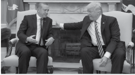
Erdoğan ve Trump ne aynı şeyin temsilcisi ne de aynı şekilde gidecek