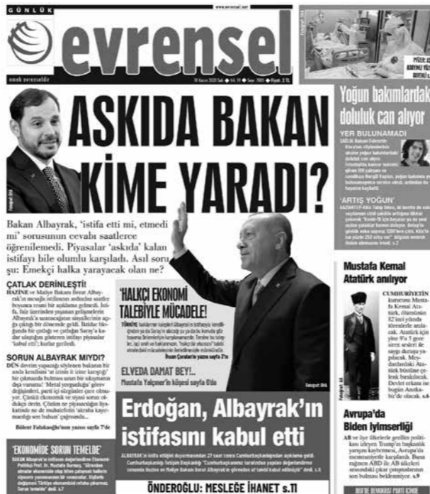
Emekçilerin umudu Albayrak'ın istifası mı?

Berat Albayrak'ın istifasına yönelik açıklamalar başka bir yönüyle sol akımların ilithak ettiği parlamentarizm çizgisini bir kez daha gözler önüne serdi. Çeşitli sol akımlar açıklamalarında Berat Albayrak'ın istifasını olumlu olarak değerlendirirken asıl sorumlunun Erdoğan olduğunu emekçilere ilan ettiler. Bu açıklamanın altında Berat Albayrak'ın istifası ile halk taleplerinin karşılandığı tespiti yatmaktadır. Bu tespitin doğal sonucu olarak bu halk öfkesi Erdoğan'a yönlendirilmeye çalışılmaktadır. Solun bu açıklamayla düştüğü po-