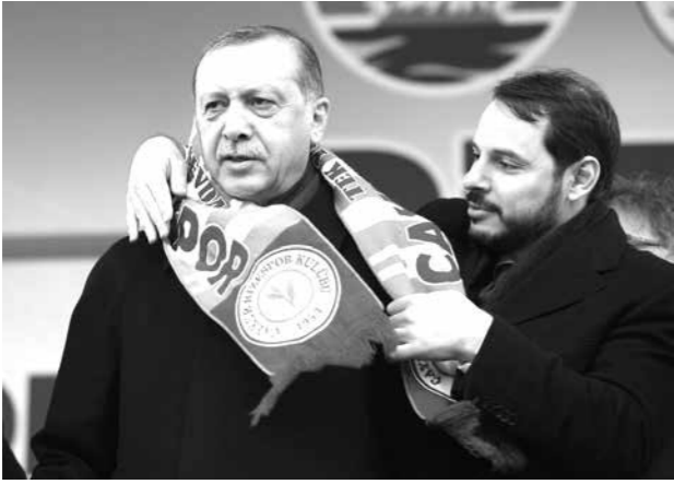
Rejim krizini göremeyenler damat-kaynıpeder kavgasına duacı oldular

Bu açıklamalara birkaç örnek vermek gerekirse, Ertuğrul Kürkçü bu istifayı aynı mantıkla bir hanedan kavgası olarak nitelmiştir. Kürkçü buna paralel olarak Berat Albayrak'ın küçük düşürücü bir şekilde görevinden silme tokat kovulmasının iktidar çekirdeğinde derin bir çatlak oluşturduğunu belirtmektedir. Musa Piroğlu ise ET-HA'ya yaptığı açıklamada iç kavga da başka bir boyutun açığa çıktığını ve “Saray rejimi”nde bir iç çatlak meydana geldiğini ve daha da derinleştiğini belirttiğini vurgulamaktadır. Bu ve bunun gibi tespitleri sol akımların açıklamalarının sağına ve soluna serpiştirilmiş halde bulmak mümkündür.