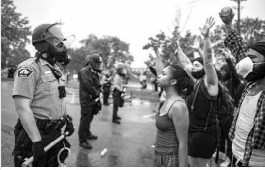
'Ufku Biden'in ötesinde' olan ABD'li isyancılara asıl alternatifi kim gösterecek

Çok değil daha bir buçuk yıl önce yerel seçimlerde sol akımların neredeyse tamamı AKP faşizmini geriletmek adına Millet İttifakı'nın adaylarını desteklemişti. İptal edilen İstanbul seçiminin ardından Köz ve Çağrı dışındaki hiçbir akım bir boykot çalışması yürütmemiş ama mağrur ama mahcup bir şekilde Millet İttifakı'nın peşine takılmıştı. İlk yerel seçimde İmamoğlu'nun karşısında aday çıkartan EHP, TKP ve TKH da bu durumun istisnası olmamıştı.